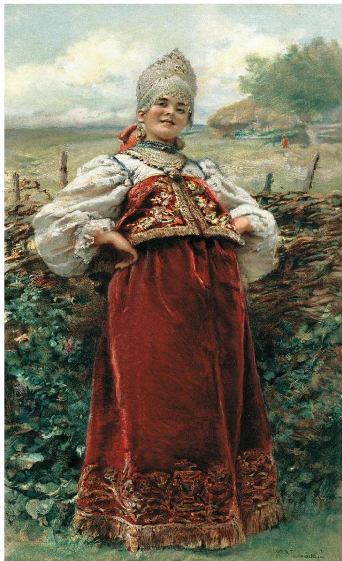
К.Маковский «У околицы»