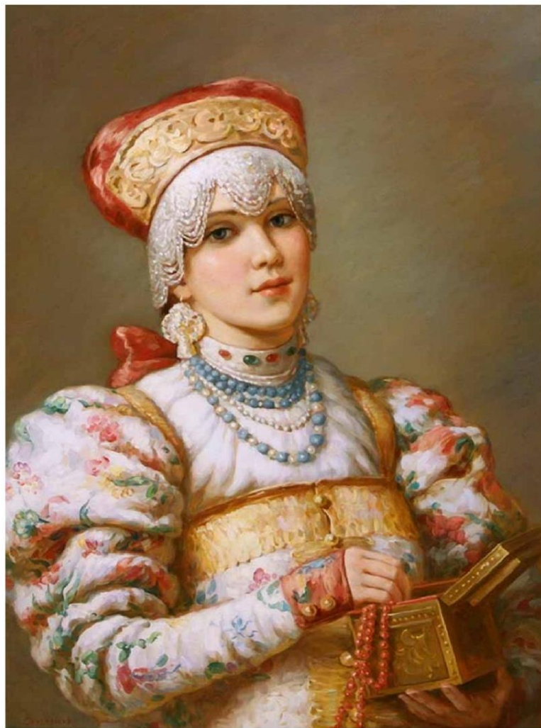
В.Нагорнов «Русская красавица»