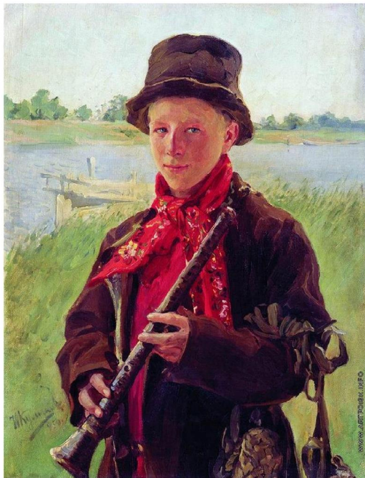
И. Куликов «Пастушок»