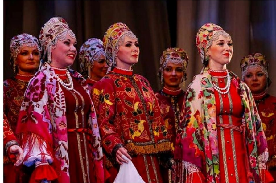
Северный русский народный хор